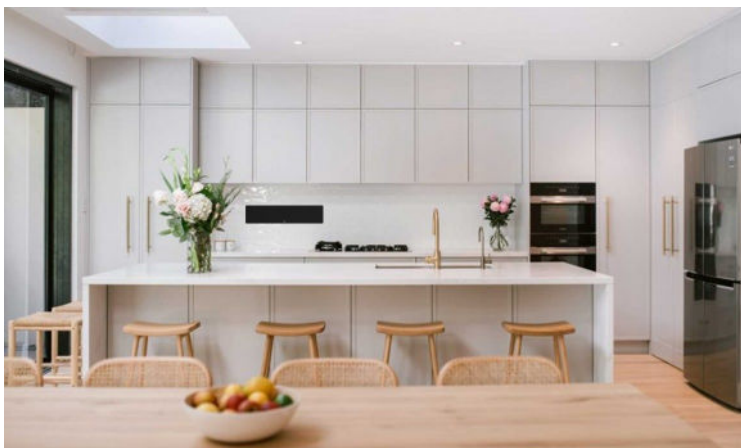
I køkkenet ...