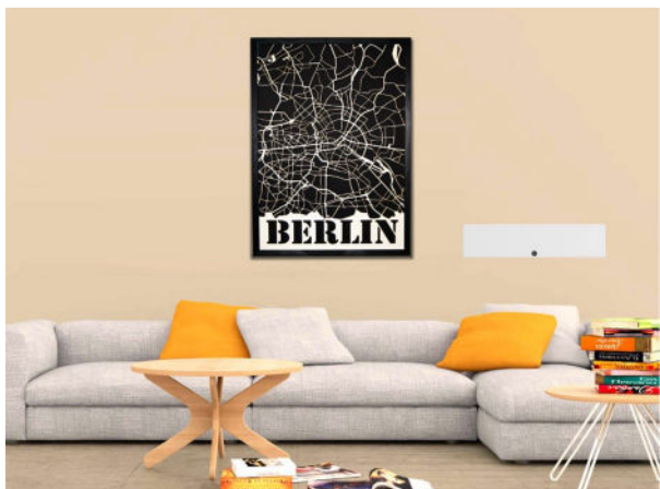
Brug den i stuen ...