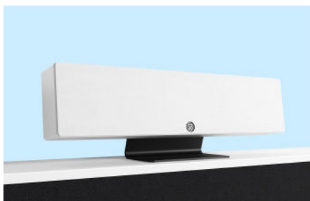
Stil den på en hylde