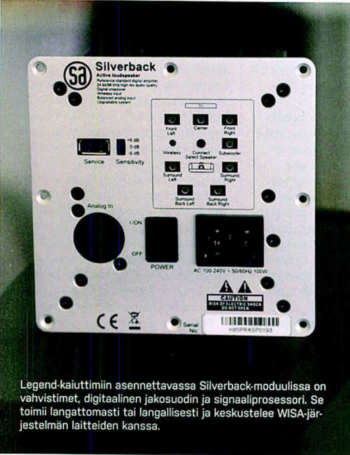
Legend-kaiuttimiin asennettavassa Silverback-moduulissa on vahvistimet, digitaalinen jakosuodin ja signaaliprosessori. Se toimii langattomasti tai langallisesti ja keskustelelee WISA-järjestelmän laitteiden kanssa.

hopeanvärisen moduuliin on pakattu hengästyttävä määrä toimintoja. Tarpeen mukaan siinä on kahdesta neljään Texas Instrumentsin digitaalivahvistinta, joista saadaan enimmillään tehoa 300 wattia, sekä kaiuttimen digitaalinen jakosuodin. Samoin siinä on edellä mainittu adaptiivinen basson ohjaus sekä muu digitaalinen signaalin prosessointi, jopa huonekorjaus.