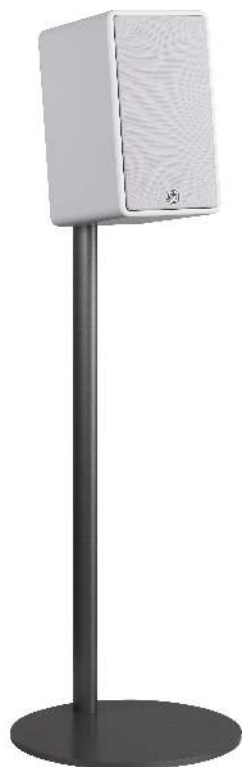
the FS3 speaker stand